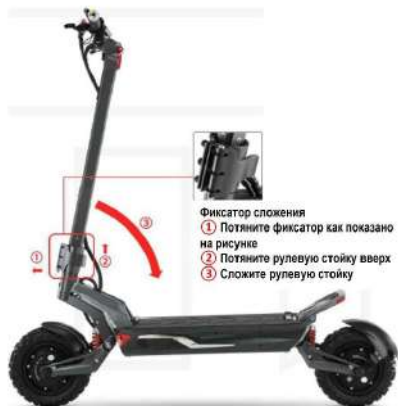
Габариты в разложенном состоянии

Высота 137 см, длина 137 см, руль 66 см, дека 57 см X 27 см