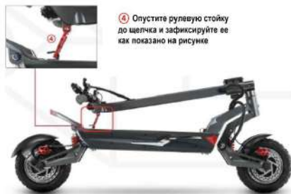
Габариты в сложенном состоянии

Высота 137 см, длина 137 см, руль 66 см, дека 57 см X 27 см